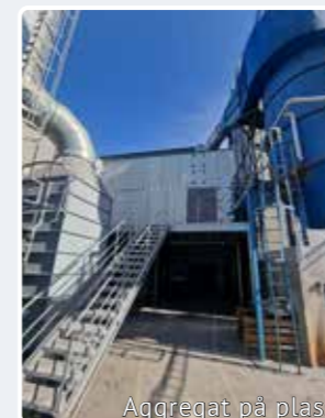
Aggregat på plass