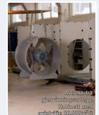
Avtrekk fra gjenvinningsanlegg. Kabinett med axialvifte 80.000m 3 /t