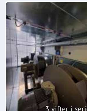
3 vifter i serie